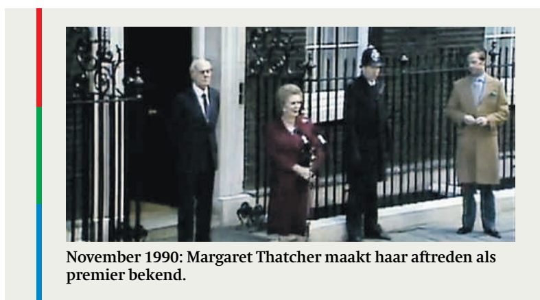
November 1990: Margaret Thatcher maakt haar aftreden als premier bekend.